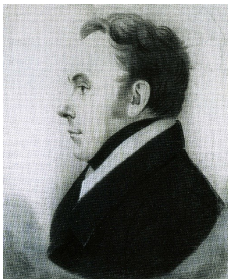
В.А. Жуковский. Худ. Э. Бушарди. 1827 г. Соус, белила