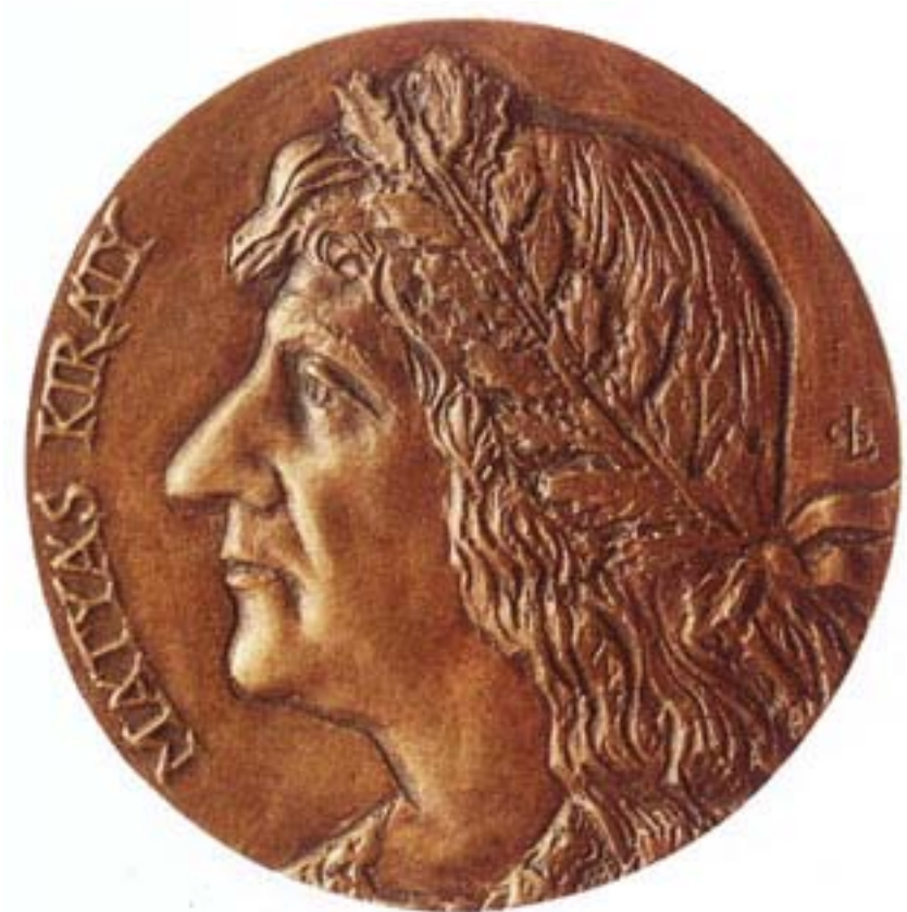
Матьяш Хуньади, король Венгрии (1443-1490)