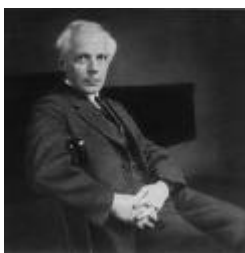
Бела Барток, композитор