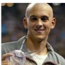
Ласло Чех, чемпион по плаванию