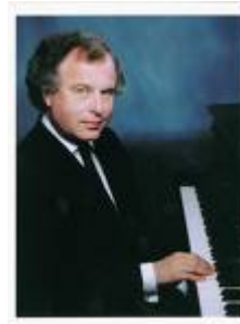
Андраш Шифф, пианист