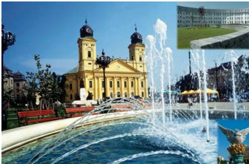
Дебрецен (население: 205 000 чел.)