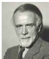
Золтан Кодай, композитор