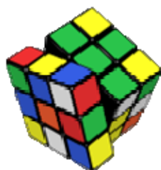
Эрнё Рубик, изобретатель дивного кубика