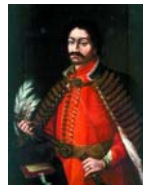
Балинт Балашши, поэт ренессанса (1554-1594)