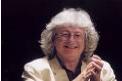
Петер Эстерхази, писатель