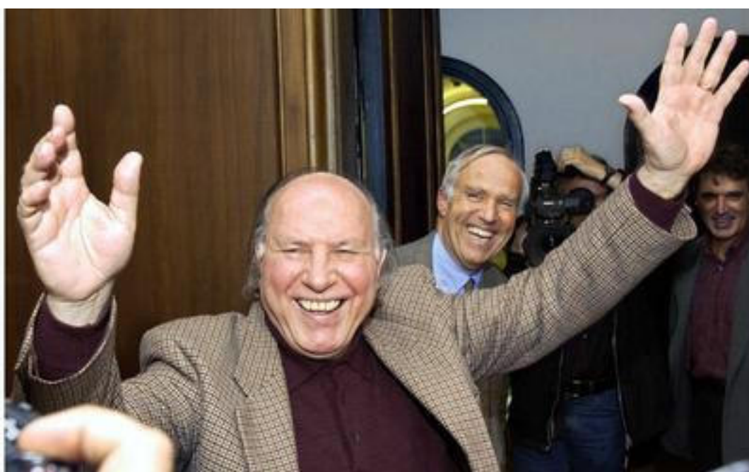
Имре Кертес, писатель, лауреат Нобелевской премии (литература)