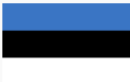
Флаг Эстонии Eesti lipp