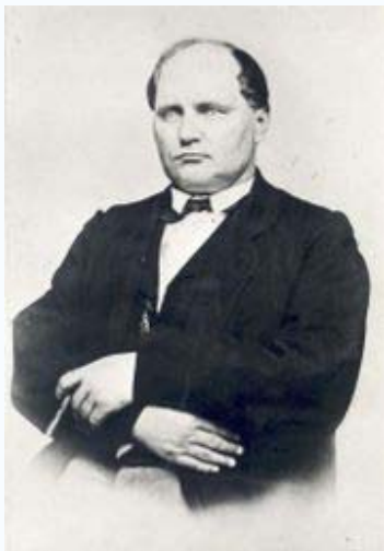
Johann Voldemar Jannsen