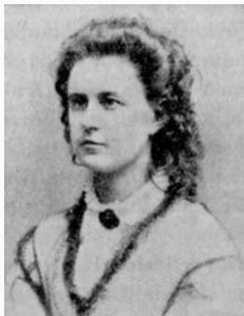
Lydia Koidula (Jannseni tütar)