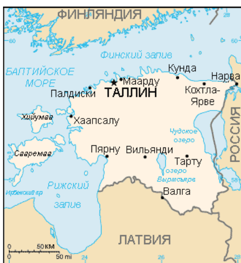
ГОРОДА LINNAD (47)

Tallinn, Tartu, Pärnu, Narva, Kohtla-Järve, Valga, Viljandi, Haapsalu, Paldiski, Kunda